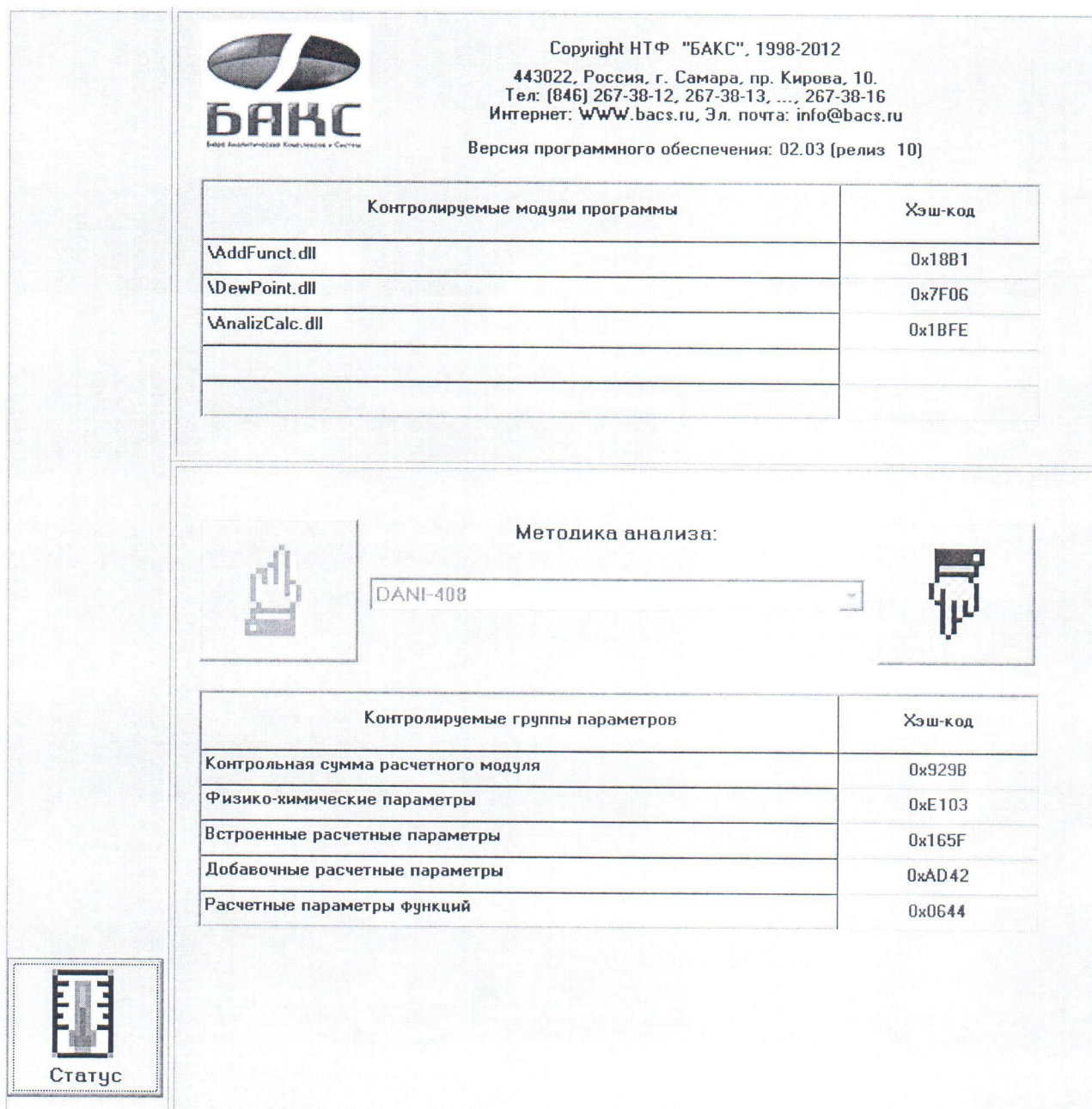
Рисунок 1. Вид диалога «Информация о ПО»

Считают, что хроматограф выдержал поверку по п.6.3, если в нижней таблице приведенный перечень CRC-кодов контролируемых блоков настроек для выбранной методики анализа (аналитической задачи) соответствует номерам (цифрам), указанным в разделе «Программное обеспечение» описания типа.